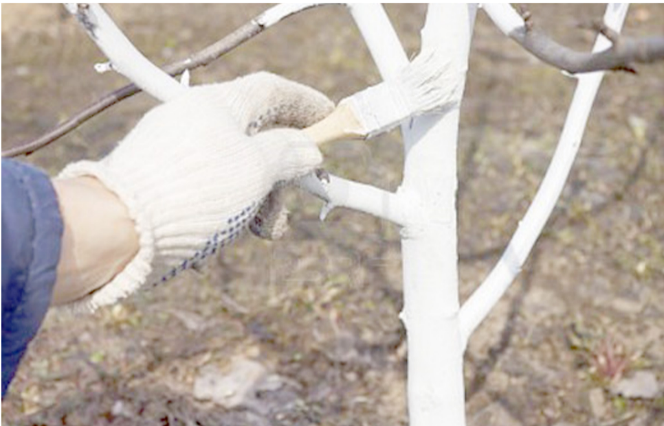
Բնի սպիտակեցումը (կրակաթի ջրային լուծույթով)

նենին, որոնք աչքի են ընկնում ճյուղառաջացման մեծ ունակությամբ և ուժեղ աճեցողությամբ: Այս պտղատեսակներից հատկապես դեղձենին լուսասեր և ջերմասեր է, հետևաբար դրա էտը պետք է նպատակամղված լինի լուսային և ջերմային պայմանների կարգավորմանը: