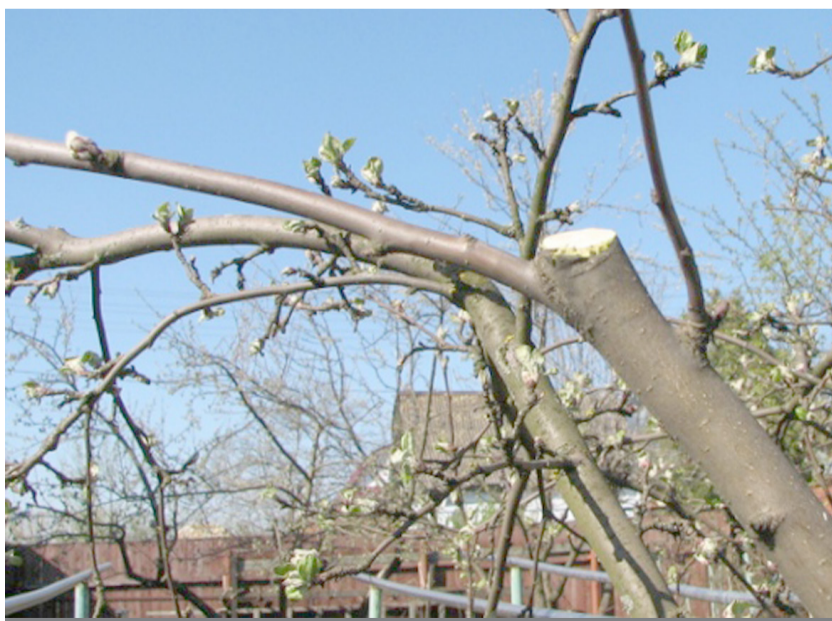
Ծառերի երիտասարդացնող էտը

Ինչպես հայտնի է, էտի եղանակը և կիրառման աստիճանը, մեծ չափով կախված են տեսակի և սորտի կենսաբանական առանձնահատկություններից: Այսպես, հանրապետությունում լայն տարածում ունեն դեղձենին և ծիրանենին: