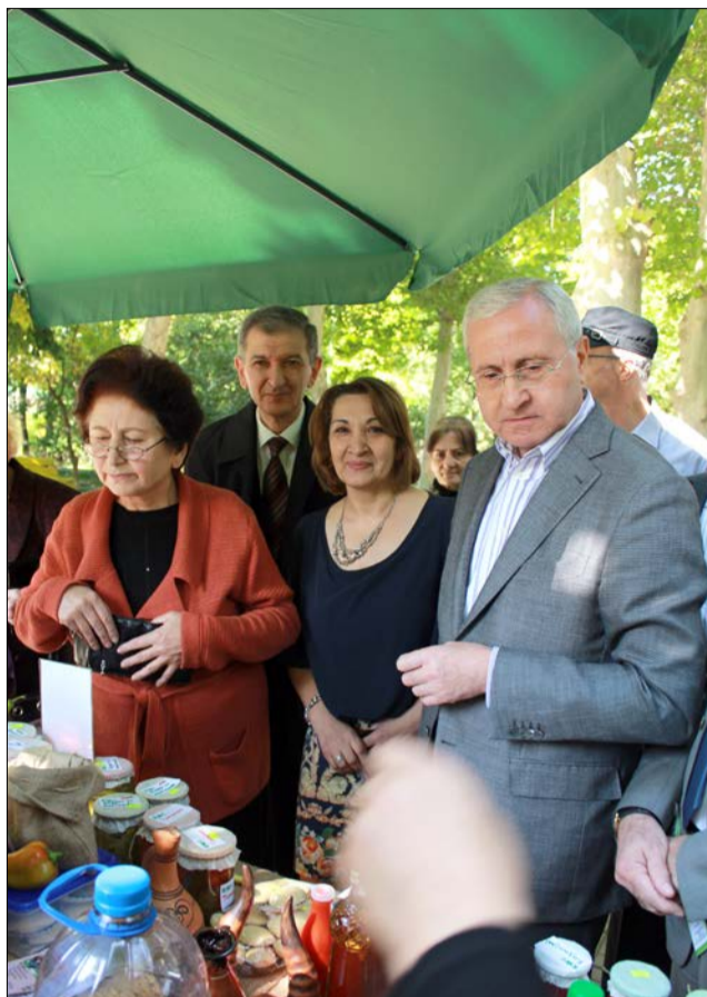
Կազմակերպությունը նաև պարբերաբար իրականացնում է ուսուցողական ձեռնարկներ, գրքեր, կրթական և տեղեկատվական նյութեր՝ կայուն գյուղատնտեսության և շրջակա միջավայրի պահպանության թեմաներով:

2014 թվականը, ծրագրային առումով, նույնպես հազեցած էր: Ամփոփվեցին մի շարք ծրագրեր, որոնցից էին Եվրամիության կողմից ֆինանսավորվող և «Անցիա սովի դեմ» միջազգային հիմնադրամի հետ համատեղ իրականացվող «Աջակցություն ՀՀ Արագածոտնի մարզի գյուղական համայնքների զարգացմանը», և Նորվեգիայի դեսպանության կողմից ֆինանսավորվող «Տավուշի մարզի Բերդի ենթաշրջանի բնապահպանական կրթության նախաձեռնություն» ծրագրերը: Առաջին ծրագրի շրջանակներում, Ապարանի տարածաշրջանում հիմնվեցին լարասյունային համակարգով ազնվամորու 35 տնկարկներ՝ օրգանական մշակությամբ, ինչպես նաև սրբեղծվեցին կանանց ֆերմերային խմբեր: Երկրորդ ծրագիրը օգնեց Տավուշի մարզի սահմանամերձ յոթ գյուղերի աշակերտների համար կազմակերպել տեսական և գործնական ուսուցումներ՝ բնապահպանության և թափոնների կառավարման թեմաներով: Այս տարի շարունակվեց Ավստրիական զարգացման գործակալության կողմից ֆինանսավորվող «Հարավային Կովկասում գյուղական համայնքների կանանց կարողությունների զարգացումը կայուն գյուղատնտեսության ապահովման համար» տարածաշրջանային ծրագիրը, որն իրականացվեց Կովկասի բնապահպանական ՀԿ-ների ցանցի և «Հիլֆուլեր Ավստրիա ինթերնեշնլ» կազմակերպության հետ համատեղ: Ծրագրի ձեռքբերումներից են Շիրակի Արեգնաղեմ համայնքում գյուղատնտեսական սպառողական կոոպերատիվի հիմնումը և գյուղական կանանց խորհուրդների ստեղծումը՝ Արեգնաղեմ, Ողջի և Բյուրակ համայնքներում: «Կանաչ արահետ»-ը 2014-ին իրականացրել է մի շարք այլ նախաձեռնություններ, այդ թվում՝ բարեգործական, որոնք նպաստել են աջակցության կարիք ունեցող մի քանի ընտանիքների սոցիալ-տնտեսական պայմանների բարելավմանը: