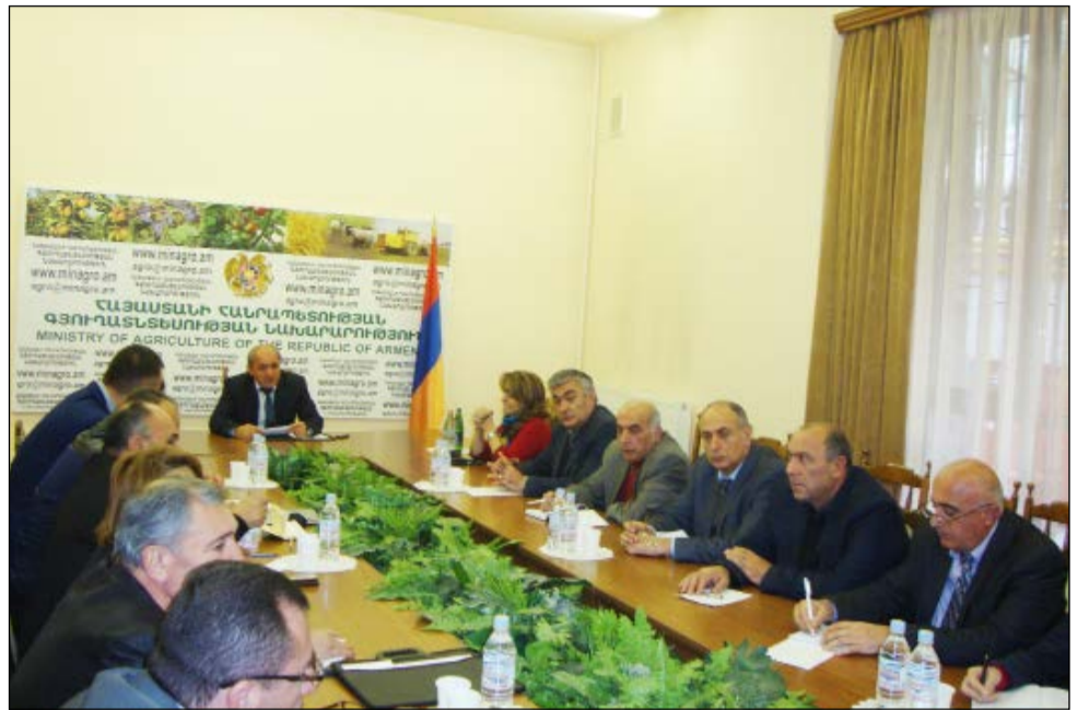
Խորհրդակցության ընթացքում մասնակիցները հանդես եկան նաև առաջարկություններով, որոնք վերաբերում էին խորհրդատվության համակարգի բարելավմանը, տեսաշարերի և լուսանկարների ներկայացմանն ու հետադարձ կապի ապահովմանը:

Չեկույցում նշված էին նաև կառավարության որոշումներն ու խորհրդատվական համակարգի զարգացման ուղիները, «Ազրոգիտություն» գիտական ամսագրի և «Ագրոլոսոս» թերթի, խորհրդատվական-տեղեկատվական թերթիկների կարևորության վերաբերյալ եզրահանգումները: