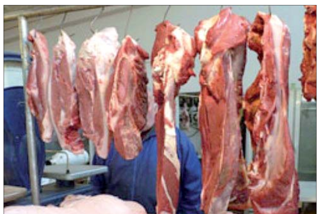
բարձրակարգ մսի արտադրության լայն հնարավորություն են ընձեռում: Ի դեպ, ճյուղի զարգացմանը նպաստում է նաև կաթի վերամշակման գործում մասնագիտացված «Վարդանուշ» ՍՊԸ, որի գործու-

Գյուղապետը ևս ստեղծել է գյուղացիական փոքր տնտեսություն, զբաղվում է ընտանեկան ֆերմերությամբ, խնամում է 10 գլուխ կով, նույնքան երկնյներ և բոմբակի ցլիկներ: «Ժամանակակից սպանդանոցի առկայության դեպքում կլուծվի նաև իրացման խնդիրը, քանի որ որակյալ մսի պահանջարկը միշտ էլ կա»,- նշում է գյուղապետը: «Բացի այդ, այդպիսով վերջ կդրվի սանիտարահիգիենիկ անբավարար պայմաններում կատարվող բակային մորթին, որի պարագայում որակյալ միս ստանալու մասին խոսք անգամ չկարող»,- հավելում է նա: Մարգահովիտի աջքի է ընկնում զարգացած անասնապահությամբ, քանի որ ալպյան գոտում տեղակայված արոտավայրերը