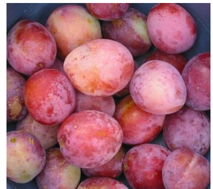
ՊԱՏԿԵՐ 2. Վիկտորիա սալորը

Ըստ գործարարների և փորձագիտական գնահատման, Հայաստանում արտադրվող