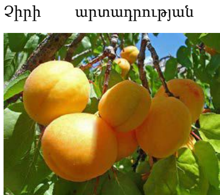
ՊԱՏԿԵՐ 3. Սաթենի ծիրանը

Հումքի առկայություն. Հայաստանում չրի առևտրային արտադրության նպատակով օգտագործվում են մրգի հետևյալ տարատեսակները (սորտերը). ծիրանի համար՝ Սաթենի սորտը, սալորի (դամբուլի) համար՝ Վիկտորիա սորտը: