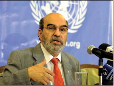
Խոսել Գրացիանո դա Սիլվա ՄԱԿ-ի Պարենի և գյուղատնտեսության կազմակերպության (ՊԳԿ) գլխավոր տնօրեն

Որքան հաճախ էք առևտրի սրահ գնացել և փնտրել ցուցադրված ամենագեղեցիկ խնձորները կամ բանանները: Գեղեցիկ փեսք ունեցող մրգին արվող մեր բնական նախապատվությունը նշանակում է, որ ընդամենն աննշան թերություն ունեցող մրգին ու բանջարեղենը փոխանակելով թափվում է: