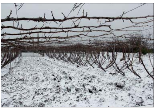
Գարնանային ցրտահարություններից վնասված այգիներում առանձնահատուկ ուշադրություն պետք է դարձնել բուսման աշխատանքների կազմակերպմանը:

Վազի վրա բազմաթիվ շվերի գոյացումից հետո, երբ կերևան ծաղկաբույլերը, բեխիկները և բերքաբու շվերը կարաբերվեն ոչ բերքավորներից, անհրաժեշտ կլինի սկսել և մինչև ծաղկման սկիզբն ավարտել առաջին շվարման աշխատանքները: