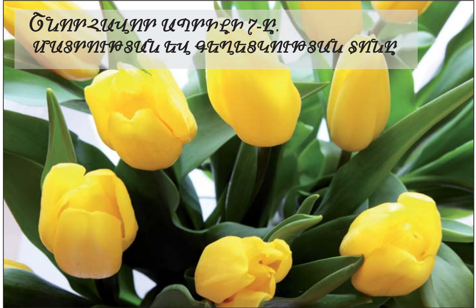
ՇՆՊՐԶԱԿՆԵՐ ԱԳՐՈՒՄԻ ԴՆԵՑՆԵՐ ՄԱՅՐՈՒՄԻ ՄԱՍ ԵՎ ԳԵՂԵՑՆԱԿՆԵՐԻ ՄԱՍ

Այն իրականացվում է հանրապետության 6 մարզի (Արագածոտն, Լոռի, Շիրակ, Տավուշ, Գեղարքունիք, Սյունիք) 55 համայնքում: Ինստրուկցիաների հաշվին, ծրագիրն իրականացվելու է լրացուցիչ և 35 համայնքում: Նպատակը՝ աջակցել անասնապահական ուղղվածություն ունեցող բարձրընթացային և սահմանափակ համայնքներին՝ հեռագնա արտադրության անցանկիության ապահովման, ջրաբերացման, դեզարդացված արտադրության վերականգնման, ինչպես նաև կաթի ընդունման և վերամշակման կարողությունների ստեղծման միջոցով: Համայնքներում ստեղծվելով արտադրագործողների սպառողական կոոպերատիվներ՝ խորհրդարանական համակարգի միջոցով աջակցություն կցուցաբերվի նորարարական տեխնոլոգիաների ներդրմանը, անասնաբուժական և փոխմային աշխատանքների բարելավմանը: ՀՀ գյուղատնտեսության նախարարության աշխատակազմի գյուղատնտեսության զարգացման ծրագրերի վարչության պետ Գրաշյա Շպիտեյանը նշեց, որ սպառողական կոոպերատիվներ են հիմնադրվել 67 համայնքում, իսկ 47-ում՝ ավարտվել են արտադրատեղի ջրաբերացման համակարգերի շինարարական աշխատանքները: Մասնավորապես՝ կառուցվել է 114 կմ ջրագիծ, տեղակայվել 150 խմբ: Արդյունքում լիարժեք օգտագործելի են դարձել շուրջ 100 հազ. հա հեռագնա արտադրեր, 60 հազ. որ սպառողական կոոպերատիվներ ծանրաբեռնվածության մեղմման արդյունքում բարելավվել է բնապահպանական վիճակը: 48 համայնքի «Արտադրագործողների միավորում» սպառողական կոոպերատիվներին տրամադրվել է 66 միավոր անիվապոր տրակտոր և 258 միավոր գյուղատնտեսական այլ տեխնիկա: